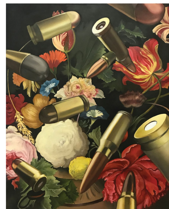
ללא כותרת (חלל), 2019, שמן על בד, 87/68 ס"מ