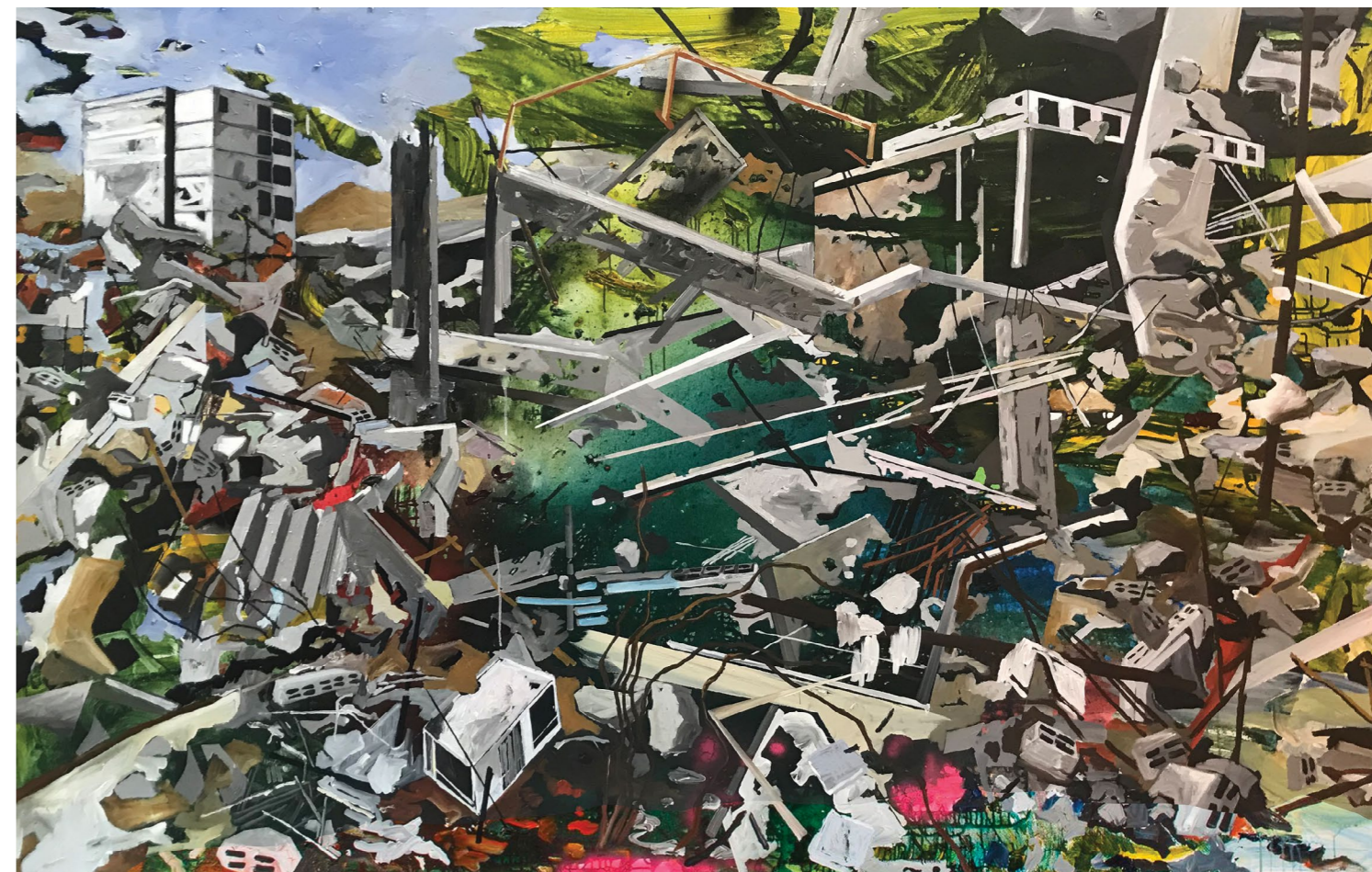
ללא כותרת, 2014, שמן על בד, 150/240 ס"מ

בציוריו המוקדמים הופיעו על הבד חללים אדריכליים עתידיניים ומנוכרים, שתוארו ע"י שימוש בפרספקטיבה רנסנסית יציבה. בעבודות מאוחרות יותר החלו להופיע בניינים המזכירים יותר את המציאות הישראלית, קרועים לגזרים ומפוררים, ומתוארים מתוך ריבוי נקודות מבט. המרחבים הארכיטקטוניים הרוסים וריקים מאדם, אך מייצרים מופע מרהיב של דינמיות וצבע. לצד חרדה מאסונות ומוות, מתקיים מעשה האמנות הבלתי פוסק, שופע חיות ומשגשג.