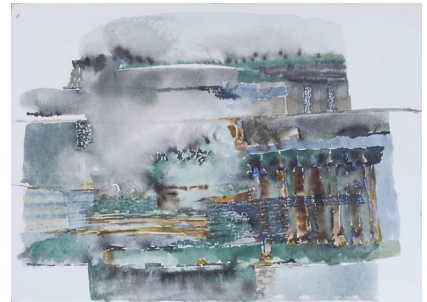
ערפל, 2019 צבע מים ודיו על נייר, 22/32 ס"מ