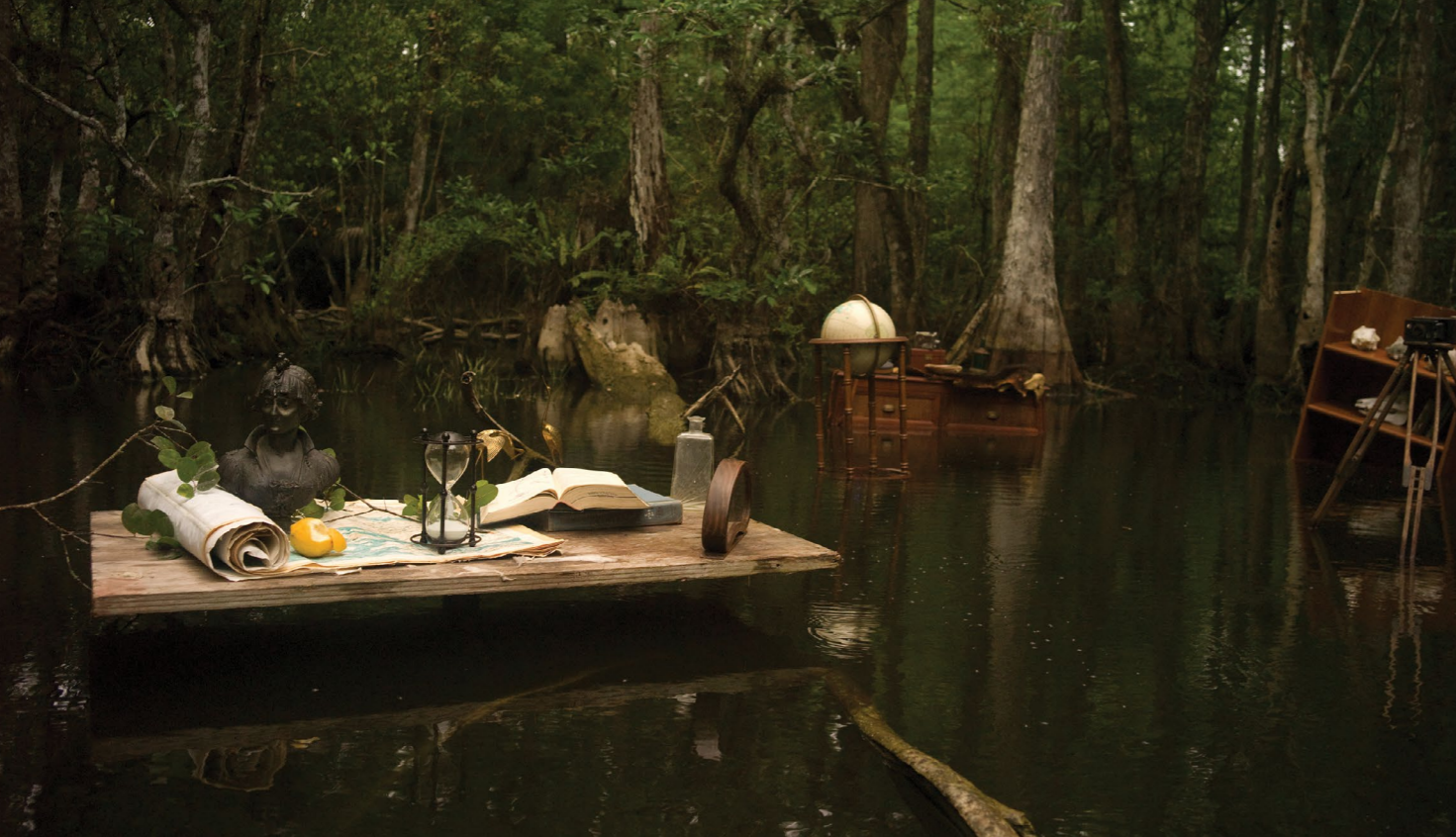
וידיאו 4:14 דקות, 2016, Emerging From the Swamp