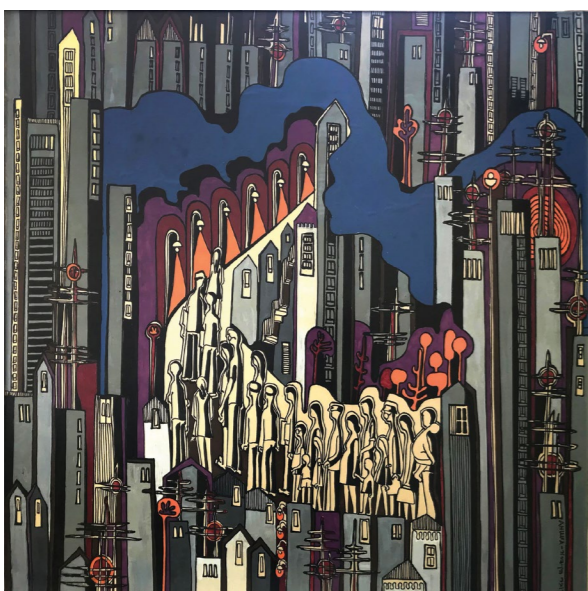
ללא כותרת, אקריליק על בד משי מודבק על עץ, 95/95 ס"מ