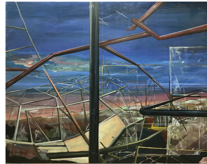
ללא כותרת, 2012, שמן על בד, 160/200 ס"מ

הבית אצל קופלר הוא מושא געגועים תמידי, והוא עוסק בו שנים רבות. ציוריו מתאפיינים בדחיסות רבה ובעומס צורני. הוא בונה והורס, מרכיב ומפרק, מסדר ופורע את המציאות. חוויית הפירוק עולה מתוך הדימויים, אך גם משפת הציור עצמה: ציוריו הם מעין קולאז' רב שכבתי המורכב מקרעי סגנונות ציוריים שונים. לצד צורות גיאומטריות ישרות, מופיעות משיכות מכחול חופשיות ואקספרסיביות, ובין כתמים אפוריים זועקים כתמי צבע פראיים.