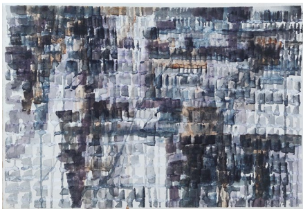
מקצב, 2015 צבע מים, 39/27 ס"מ

בתערוכה מוצגות עבודות בטכניקה מעורבת המשלבת צבעי מים, אקריליק, דיו וקולאז'ים על מצעים שונים. כל עבודה מאופיינת בפאלטה צבעונית ובמקצב ייחודי משלה. עבודותיה צומחות מתוך חוויה אישית. תהליך העבודה איננו מנוסח מראש, והוא נרקם בהדרגה, בעבודה רב שכבתית, מתוך מאגר של אסוציאציות וזכרונות, ללא סיפור סדור, וללא הגדרת זמן ומקום.