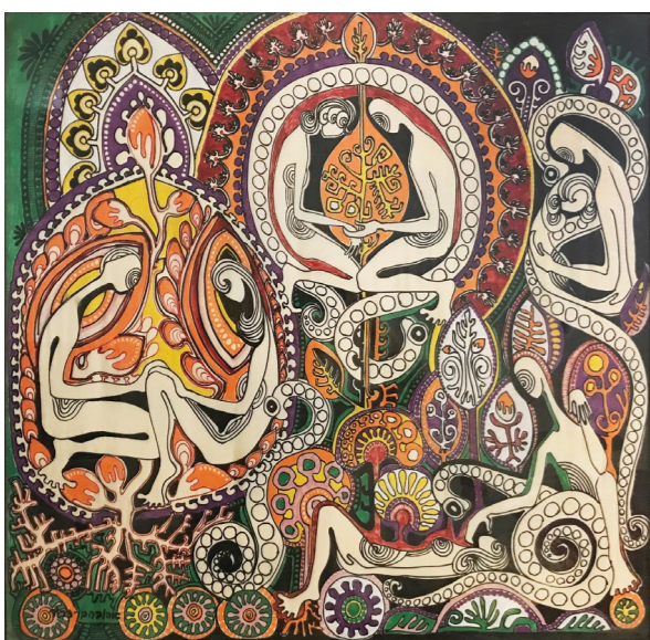
ללא כותרת, אקריליק על בד משי מודבק על עץ, 85/85 ס"מ