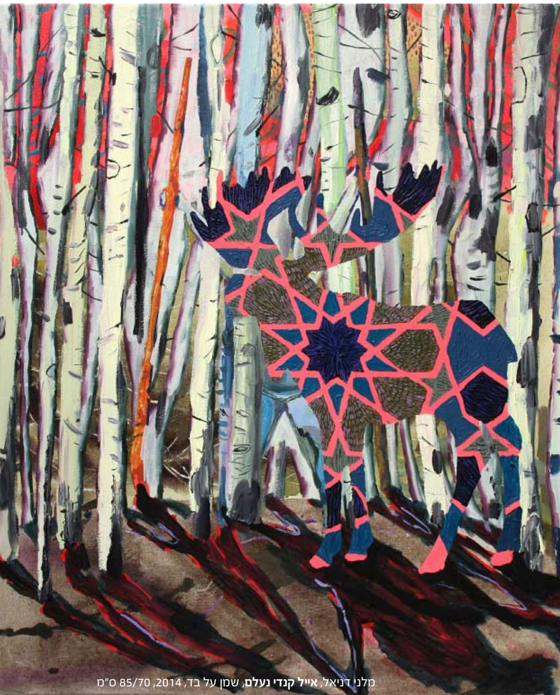
מלני דניאל, אייל קנדי נעלם, שמן על בד, 2014, 85/70 ס"מ