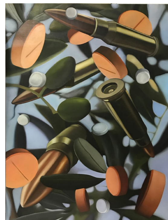
ללא כותרת (זיתים), 2018, שמן על בד, 120/90 ס"מ

העבודות בתערוכה מהוות פרשנות אישית ועכשווית לציורי ה"ואניטס" של תקופת הבארוק, שעסקו בציווי הנוצרי "זכור את יום מותך" (ממנטו מורי). ציוריו של קלוס מבטאים מחוזות פנימיים ורגשיים. רגעים של מפץ שנלכדו והוקפאו, מאירים את תהומות הנפש: אלימות פנימית, אבדן דרך, איון הגוף. בכל ציור מתואר מקטע מתוך רצף אינסופי של חלל כאוטי וחסר היגיון. החפצים בחלל אינם מצייתים לחוקי המשיכה, והפרופורציות ביניהם משובשות. גם נקודת המבט הלא שגרתית מחזקת את תחושת ההזרה.