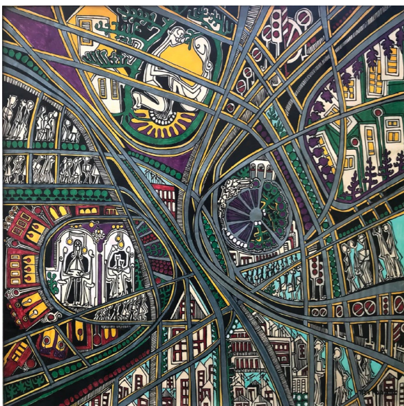
ללא כותרת, אקריליק על בד משי מודבק על עץ, 95/95 ס"מ

בציוריה אין כמעט ביטוי לחיי הקהילה החקלאית שבתוכה התגוררה מרבית חייה. בשונה מרוח תקופתה, בן דרור לא ניסתה לתאר את ההרמוניה בין האדם לטבע, כמו בציוריהם של מודרניסטים ישראלים כדוגמת נחום גוטמן או יוחנן סימון. בתוך מרחבים מופשטים ודמיוניים, מכונסים בתוך עצמם תאים משפחתיים קטנים, ללא קשר עם סביבתם. לעתים הערים ריקות מאדם, ולעתים מהלכות בהן כצללים שיירות פליטים.