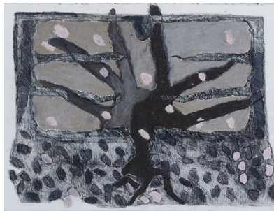
sketch book, 2018 פנדה ועפרון על נייר, 33/29 ס"מ