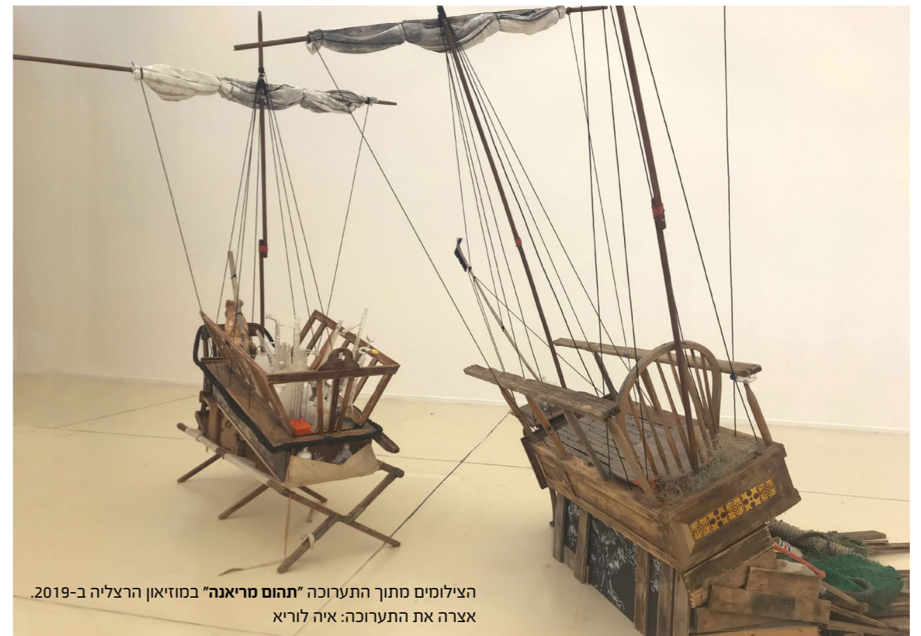
הצילומים מתוך התערוכה "תהום מריאנה" במוזיאון הרצליה ב-2019. אצרה את התערוכה: איה לוריא

"אני רואה בזה הזדמנות אדירה. אני חושבת על זמן שבו נולדת תרבות חדשה על חורבות כל התרבות והחפצים שאנחנו משאירים מאחורינו; על מחזור חיים שבו נעלמות הפרדות בין חי, צומח ודומם ונוצרים אורגניזמים חדשים מכל מה שהשארגנו אחרינו. זו מחשבה על החיים היום, כמו משקפת זמן, מבט חזרה על הזמן שלנו משנת 2150. זאת עבודה על עכשיו, לא על העתיד. על כל מה שאנחנו משאירים אחרינו." (מתוך ראיון לחגית פלג רותם, פורטפוליו, 2019).