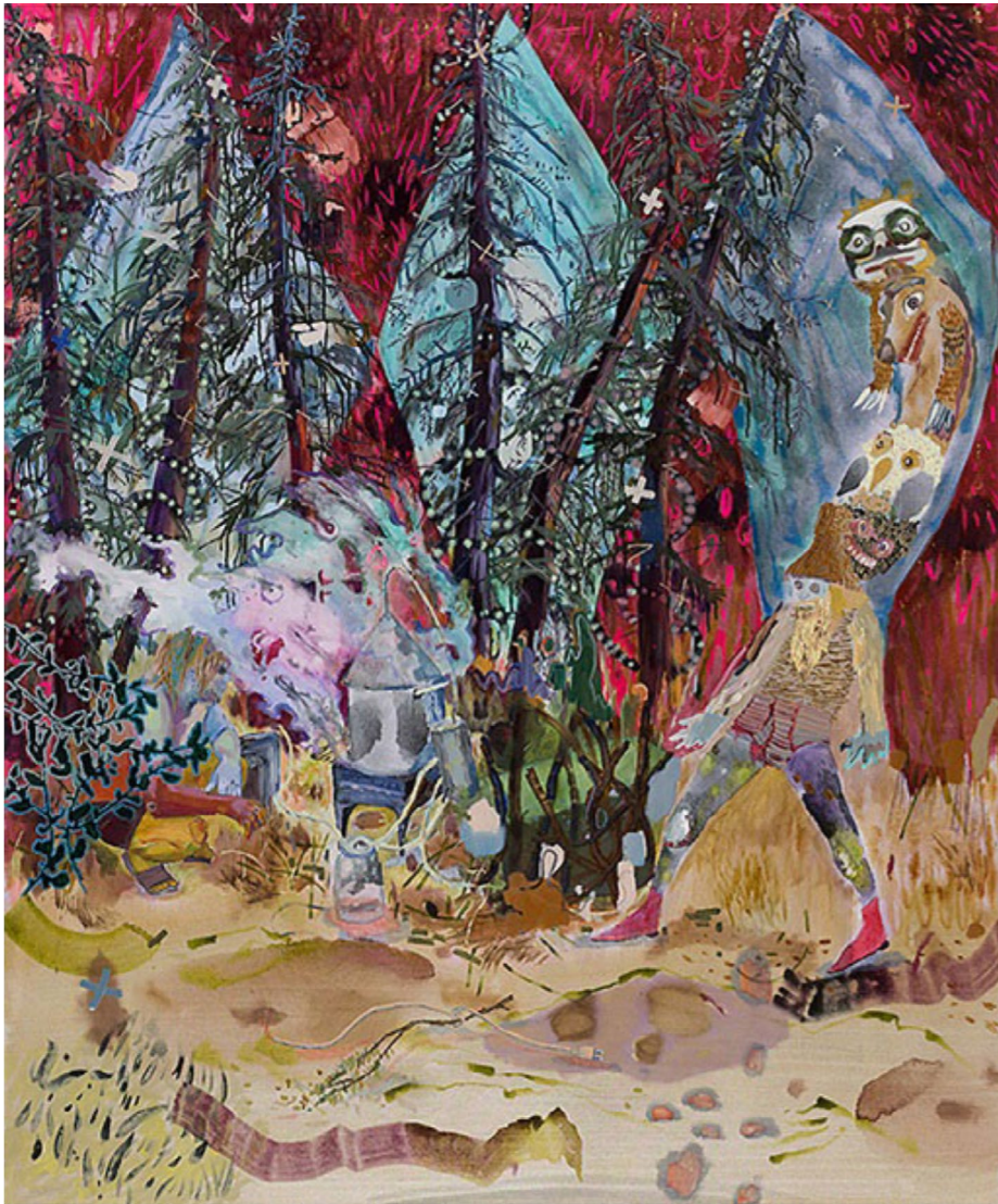
Moonshine of the Yellow Beards, שמן על בד, 2013, 180/150 ס"מ